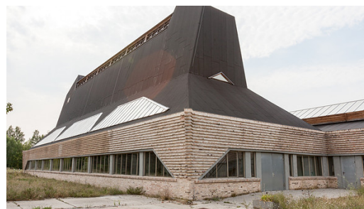
Hutfabrik von Erich Mendelsohn